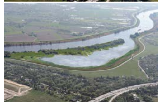
Neuer Flutraum entsteht. Das Pilotprojekt Kreetsand reduziert die Strömungen und schafft wertvollen Lebensraum.