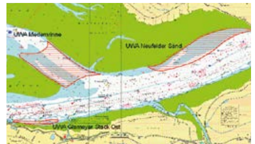
Strombaumaßnahmen in der Mündung dämpfen die Gezeiten und reduzieren den Sedimenttransport im Ästuar.

Die Baggermengen lassen sich durch eine flexible und adaptive Umlagerungsstrategie reduzieren. Dabei werden Sedimente so im Gewässer umgelagert, dass sie möglichst nicht durch den Flutstrom wieder dorthin zurücktransportiert werden, wo sie bald erneut gebaggert werden müssten. Zusätzlich kann das Gewässer durch strombauliche Maßnahmen so gestaltet werden, dass grundsätzlich weniger Sedimente stromaufwärts transportiert werden.